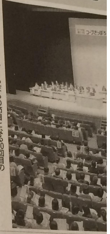
コピーさっぽろの節目となる50回目の総代会が札幌で開かれた